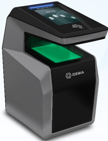
【 MorphoWave XP 】 IDEMIA 製

歩きながらでも4指の指紋を非接触で高速かつ正確に読み取り可能な指紋認証装置です。