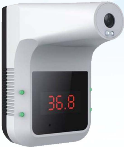
【ノントOUCHチェッカーズ】 株式会社レッツ・コーポレーション 製

壁などに簡単に取付が可能な非接触体表温検知装置です。異常な体表温の場合には光と音でお知らせし感染症対策をサポートします。また、入退室管理システムと連携させる事により、感染症対策セキュリティシステムを構築する事ができます。