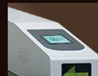
■認証表示LED(カードタッチ部)