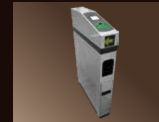
■クリップ付カードホルダー回収機(連結)