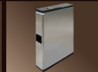
■クリップ付カードホルダー回収機(別置)